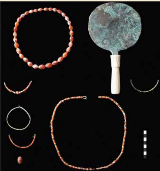
Man fandt også spejle i graven i Asasif, bl.a. dette med lotusformet håndtag.