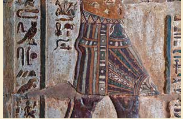
Der kommer meget fine og hidtil usete detaljer frem ved restaurering af relieffer.