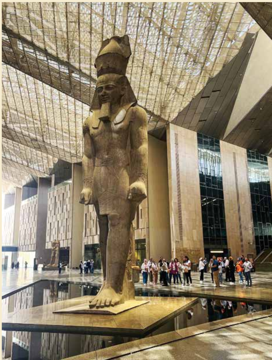
Statuen af Ramses II er det naturlige fokuspunkt i Den Store Hall, men det er ikke kun Ramses' cartouche, der pryder indgangen til Grand Egyptian Museum.

Selvom der stadig ikke er tale om en officiel åbning og selvom der er sale og