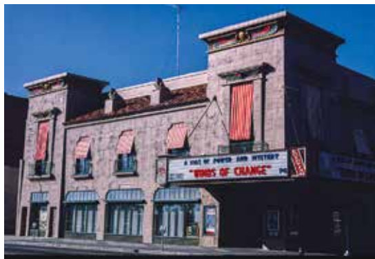
The Egyptian Theater i Boise, Idaho, bygget i 1927.