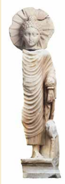
Marmorstau af Buddha fundet i Berenike.

◆ Lagt på nettet 9. februar 2023 https://english.ahram.org.eg/News/487825.aspx .