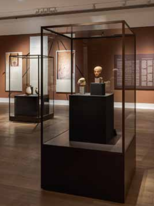
Amarnaudstillingen på Glyptoteket.

I forbindelse med udstillingen er der udgivet et rigt illustreret katalog med bidrag fra internationale eksperter i Amarnaperioden. Lise Manniche skrev om det mere u håndgribelige: skønhed, klædedragter, duft og musik i Amarna.