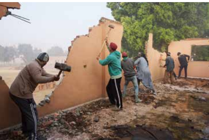
Øverste etage på Abu Hol Sports Clubs forfaldne bygning brydes ned.