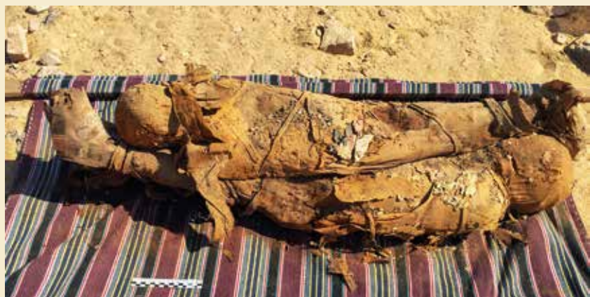
Fund fra den græsk-romerske grav på Aswans vestbred.

Selvom graven, som forskerne daterer til græsk-romersk tid, var røvet allerede i oldtiden, indeholdt den omkring 30 mumier og mange andre interessante ting. Gravens østvendte væg bestod af en mængde knogler, mestendels fra får, keramikfragmenter, offerborde og stenstykker med hieroglyf-