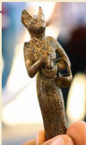
T.v. Bronzefigur af Bastet i. T.h. Isis og Neph-tys.

Det nyligt annoncerede fund bestod blandt meget andet af en stor samling af gudestatuetter i forskellige størrelser, alle fremstillet i bronze. Statuerne forestiller Bastet, Anubis, Osiris, Amun-Min, Isis, Nefertum, og Hathor. Arkæologerne fandt også rituelle instrumenter, en hovedløs statue af Imhotep, en samling af bemalede sentids-sarkofager i træ, amuletter, trækasser, statuer med forgyldte ansigter, kosmetiske gen-