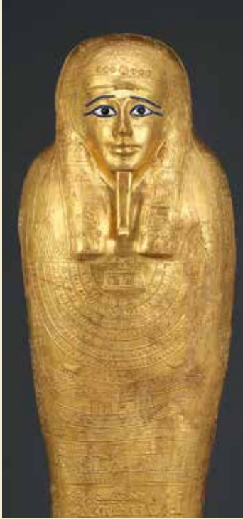
Nedjemankhs forgyldte sarkofag.

seet hævder til sit forsvar, at det er “offer for en international kriminel organisation”.