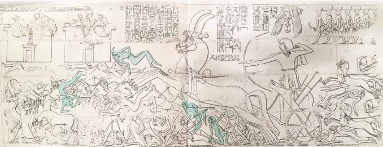
Farao vinder over libyerne. Scene fra Medinet Habu, II, pl. 70. Efter LM.