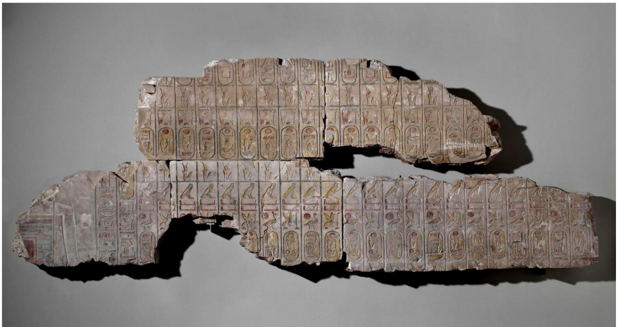
Del af kongeliste fra Ramses II's tempel i Abydos (British Museum EA117)