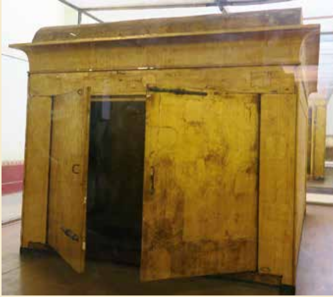
Det andet skrin.

bagen. Det lykkedes dog at flytte dem de 600 km til Cairo og bakse dem op ad trapperne til førstesalen på museet.