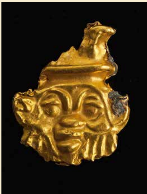
Et Bes-hovede var en del af fundet.