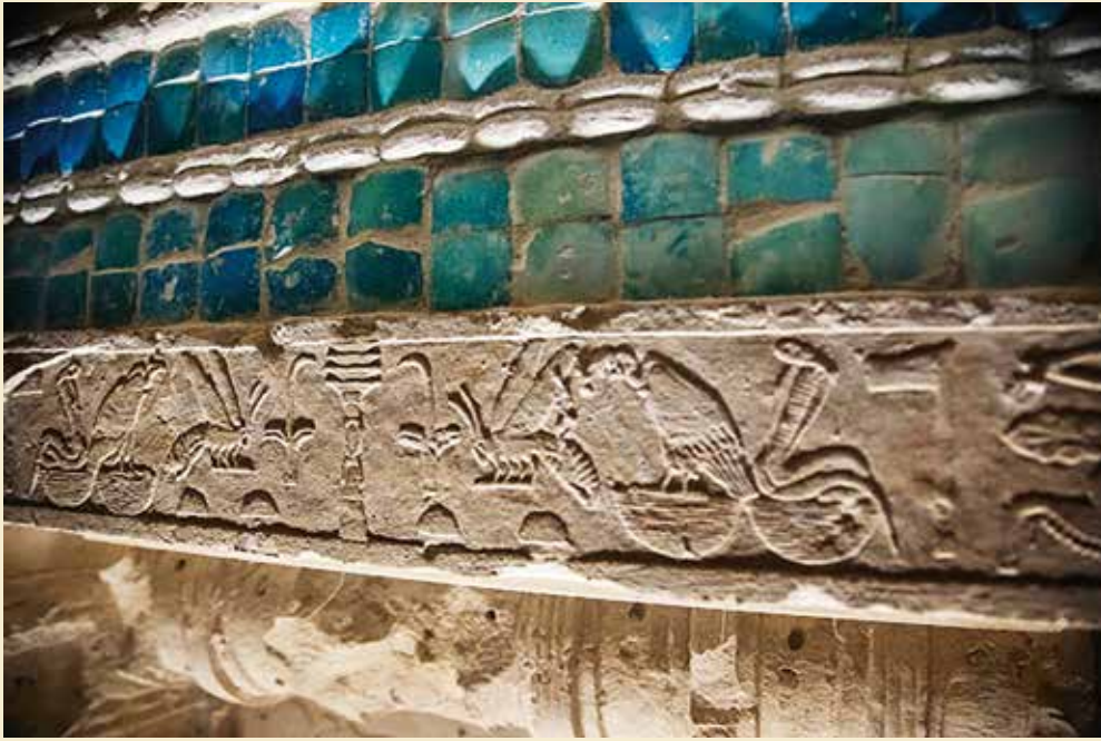
Fra Djosers sydgrav.

til projektet i form af 3 millioner dollars. Det oplyser Omura Yoshifumi, der repræsenterer JICA i Ægypten. De 3 millioner kommer oveni de 2 millioner, JICA allerede har doneret til udgravningen af båden.