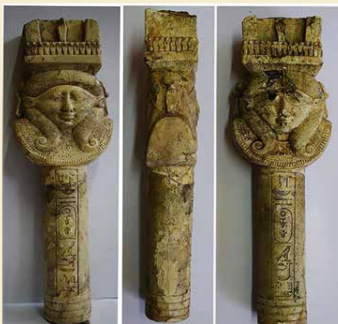
Fajancesistrum med Psamtik I's navn.

bund. Skibet blev fundet under næsten fem meter af hårdt ler blandet med rester fra templet.