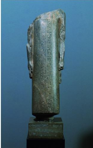
Paser (Glyptoteket ÆIN 50)