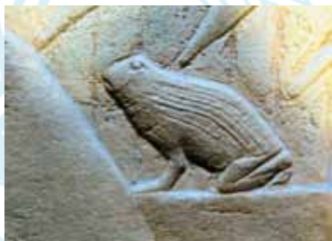
Frøamulet i det nationale arkæologiske museum i Athen.