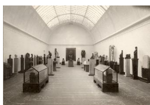
Sal 1 før 1912 med kister og Anubis i centrum