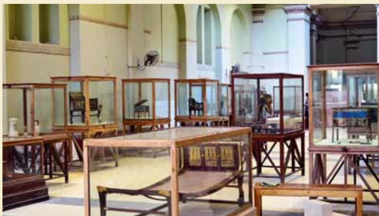
Yuya og Tuyus gravudstyr erstatter Tutankhamons.

■ Lagt på nettet 23. november 2018 http://weekly.ahram.org.eg/News/25917.aspx