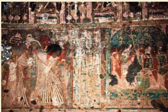
Vægmaleri i Usermontus grav.