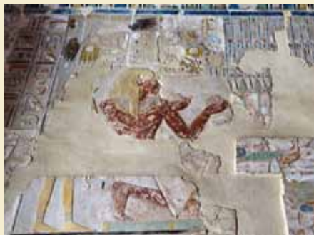
Prinsesse Neferura og dronning Hatshepsut ofrer til Amons hellige båd.

Polske og ægyptiske arkæologer har arbejdet i Hatshepsuts tempel i Deir el-Bahri siden 1961, og det restaurerede tempel er gradvist blevet åbnet for publikum. Arbejdet i templets hoveddel, helligdommen viet til Amon-Ra, er færdigt, og det er ved at være nogle år siden, offentligheden fik adgang templets tredje terrasse og solgården. Desværre er rummene, der omgiver tredje terrasse så smalle, at der ikke er adgang for publikum. Derfor har de polske arkæologer sammen med universitetet i