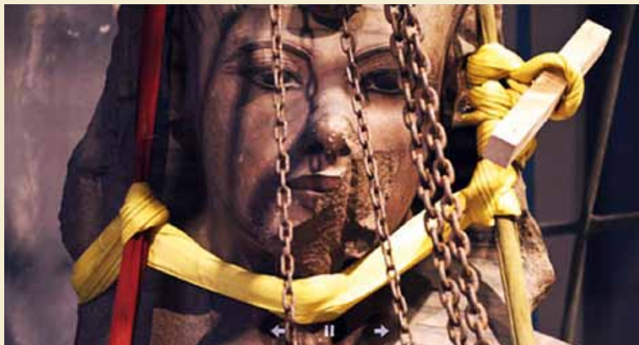
Kolossalstatuen af Tutankhamon under transporten.

▪ Lagt på nettet 3. marts 2018 http://english.ahram.org.eg/News/292036.aspx