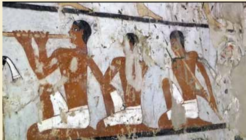
Musikere med gestikulerende bavian.