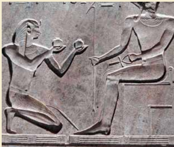
Psammetik foran Atum.