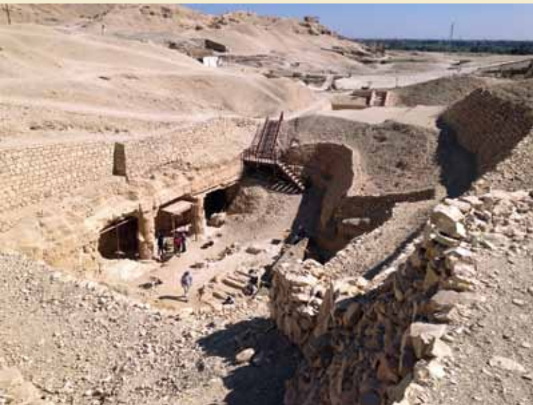
Nefersekherus grav TT 107.