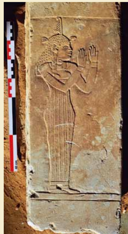
En meroitisk Maat.

■ Lagt på nettet 11. januar 2018 https://telledfu.uchicago.edu/news/press-release-jan-2018-submitted-dec-2017