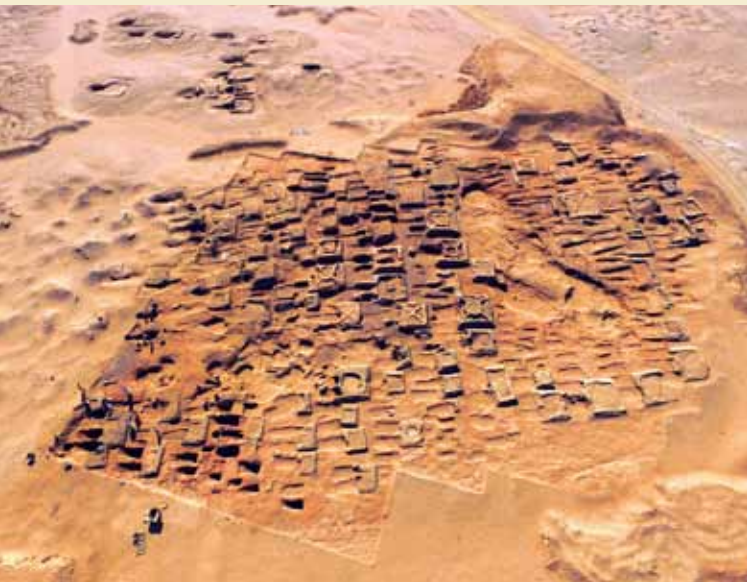
Udgravningen i december 2017