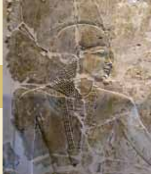
Khaemhat i Berlin.

Udgifveren er CEDEA ( Center of Documentation and Studies on Ancient Egypt ), der blev etableret i 1956 især med henblik på at dokumentere monumenter, der var truet af Nassersøens vande, og senere arkæologiske levn fra templer og grave til graffiti på vestbredden af Luxor. Scener fra graven blev først kopieret af de tidlige rejsende (Nestor L'Hôte, Wilkinson, Lepsius m.fl.), og en beskrivelse af graven af V. Loret i udkom 1889. Fotografier af detaljer af udsmykningen foreligger i mange publikationer om ægyptisk kunst. En omhyggelig kopiering af alle indskrifterne blev udført af Abdel Aziz Sadek† for CEDAE i 1967, hvor også reliefferne