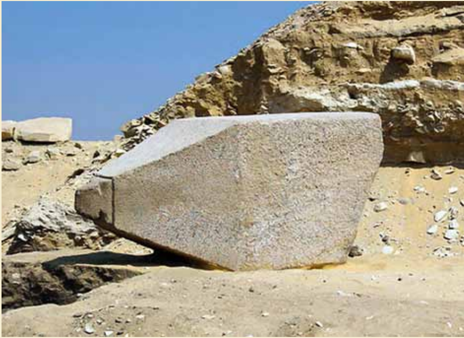
Den øverste del af obeliskken i Sakkara.

1,3 m høj. Dronningens pyramide har været kendt siden 1998. [LM]