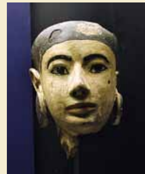
(c) Hovedet fra Aperels grav. Foto LM; (d) Relief i Louvre. Foto LM.

■ Lagt på nettet 18. oktober 2017 https://luxortimesmagazine.blogspot.dk/2017/10/4000-years-old-wooden-head-discovered_18.html?m=1 .