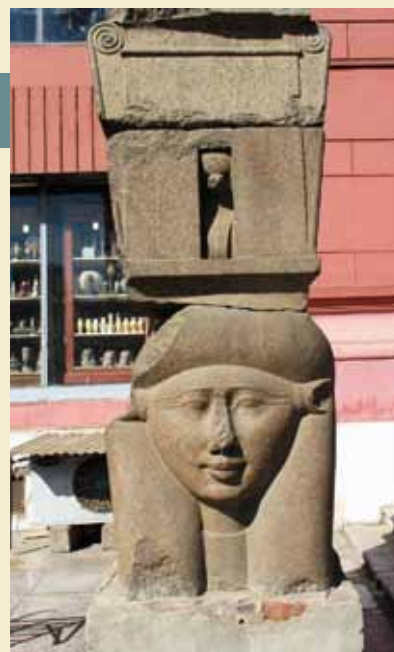
Hathor-hovedet, der nu er flyttet til GEM. Foto 2009 LM.

I løbet af efteråret er der blandt andet blevet transporteret en række statuer fra det gamle museum til GEM. Det drejer sig om statuer af Khefren, en buste af Tuhtmosis II med nemesklæde, en granitstatue, der forestiller Hathor, kolossalhovedet af Userkaf samt to store kalkstensfragmenter fra Giza-sfinxens skæg. Disse genstande skal udstilles på GEM's store trappe. Inden transporten til GEM er genstandene blevet restaureret, ligesom der er blevet skrevet detaljerede rapporter om deres bevaringstilstand.