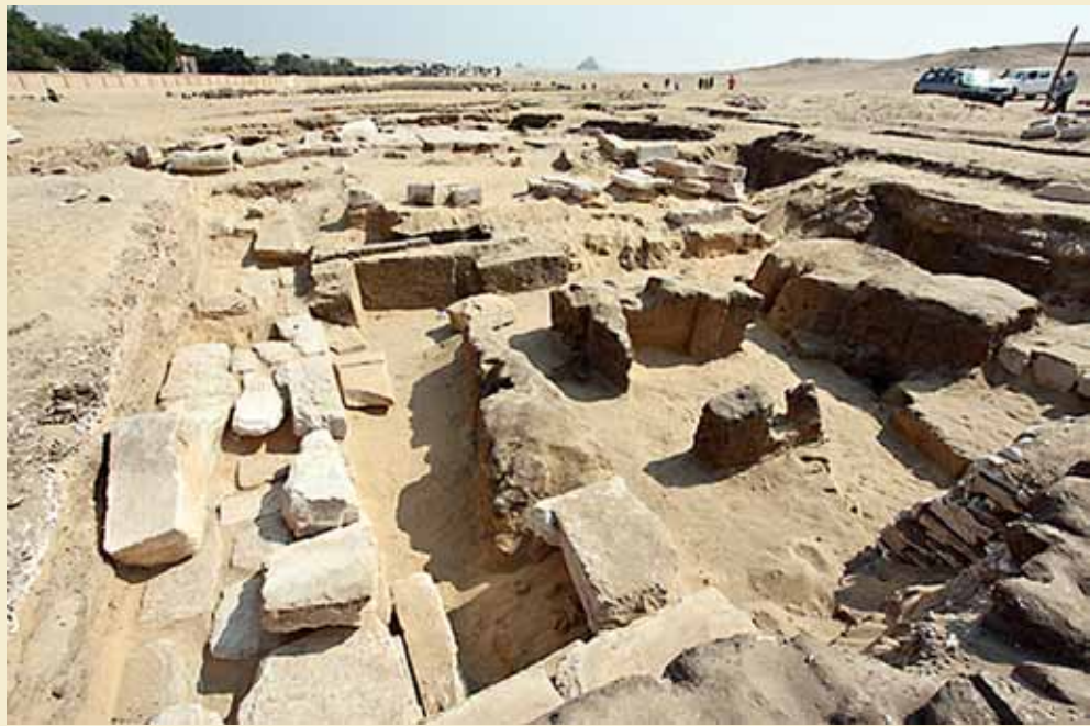
Templet i Abusir.

Ramesses II byggede templer over hele Ægypten, og i Abusir har Miroslav Barta og et tjekkisk/ægyptisk hold udgravet resterne af endnu et tempel med denne konge som bygherre. Templet