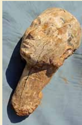
(a) Foto Ministry of Antiquities; (b) Hovedet i Cairo. Foto LM;

Et lignende hoved er i Cairo-museet (b), og yderligere et, fundet af Alain Zivie i vesiren Aperels grav, kan ses i Imhotep-museet (c). Kombinationen af kronrajet hoved og oblatformede ørenringe kendes fra andetsteds i slutningen af 18. dynasti, som f. eks. i et Amarna-relief i Louvre (d). [LM]