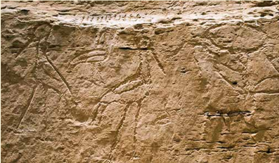
Store hieroglyffer i el-Kab.