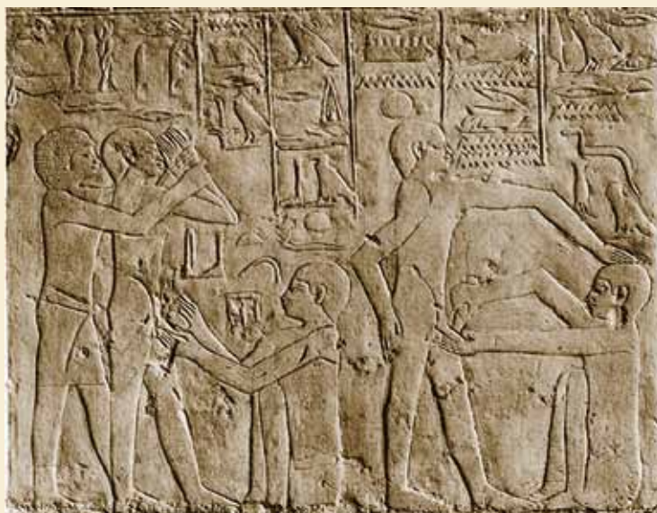
Kirurgen i arbejde.

Begravelsesområdet el-Lisht, som blev brugt af konger og embedsmænd i Mellemste Rige, ligger syd for Dahshur. Her findes bl.a. Amenemhet I's og Sesostri I's pyramider, omgivet af mindre pyramider samt mastabagrave. Amerikanske og ægyptiske arkæologer