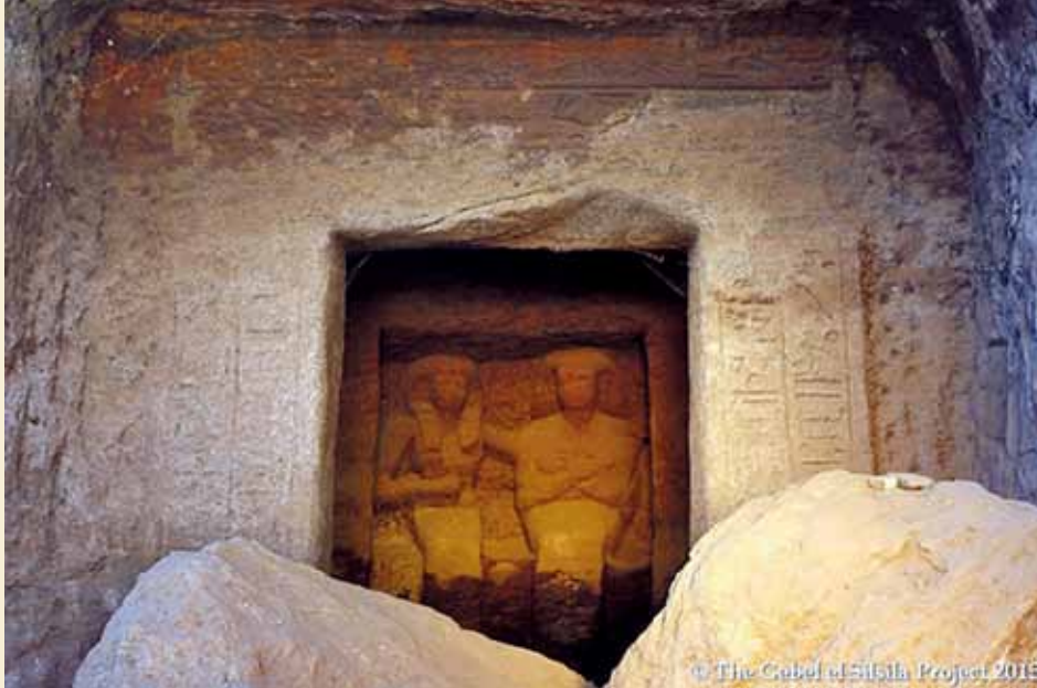
Ill. fra nettet. Foto The Gebel el Silsila Survey Project, courtesy the Egyptian Ministry of State for Antiquities.

hånd på mandens ryg og den anden placeret under brystet.