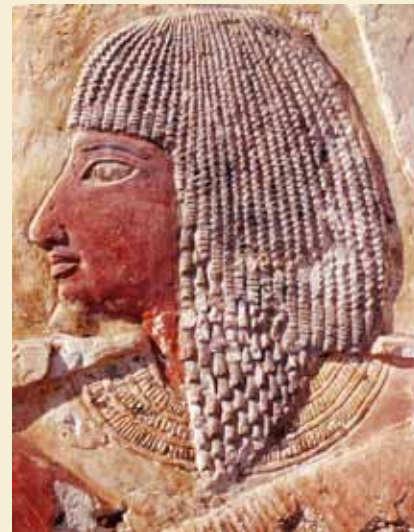
Vesiren Netjeruimes.

Unas-pyramiden er nu også genåbnet efter at have været lukket i 20 år. Gravkammeret er et besøg værd med sin kiste og pyramidetekster og geometrisk udsmykning på væggene. [LM] Lagt på EEF 2. juni 2016.