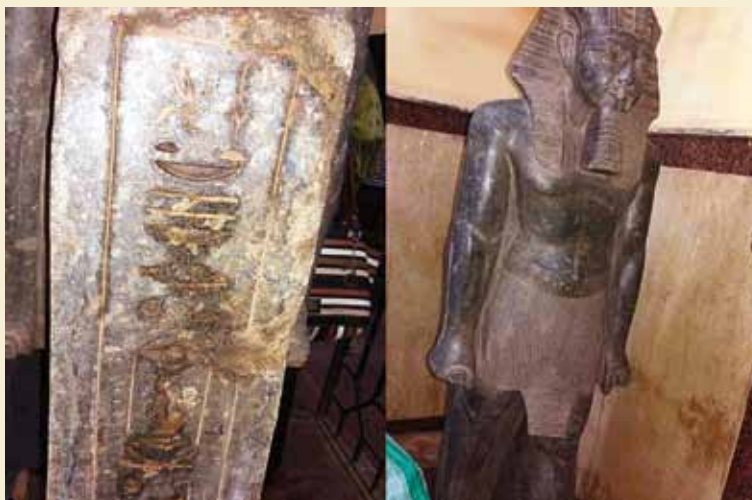
Amenhotep III fra Edfu.