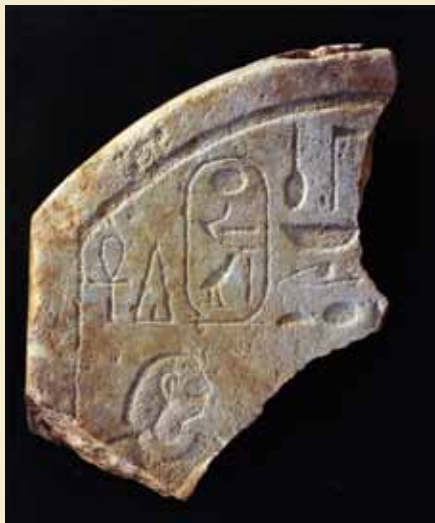
Rest af stele fra 12. dynasti fundet i Berenike.

Om projektet, der udføres af University of California, se http://cylinders.library.ucsb.edu/ (LM)