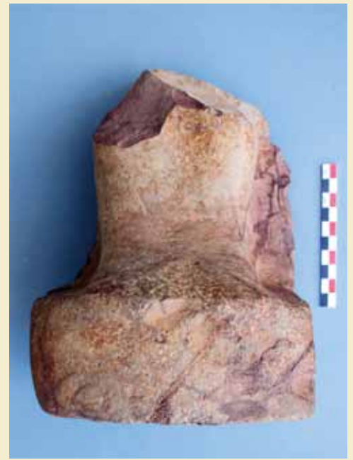
Sahuras statue.

i Kongernes Dal, der også er genåbnet. Se glimrende billeder på Bernard Adams' hjemmeside her: http://egyptmyluxor.weebly.com/three-new-toms-opened-ndash-qurnet-murai.html