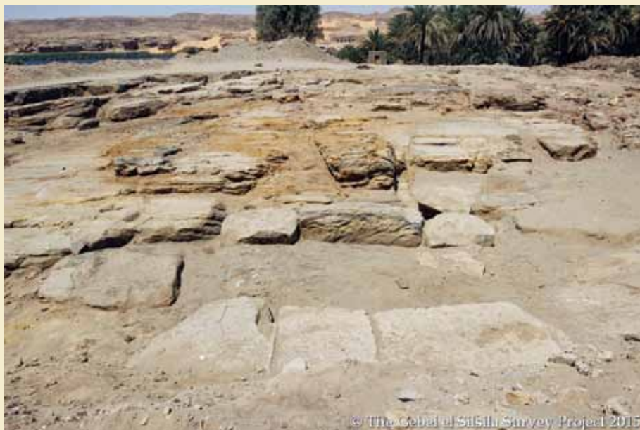
Gulv i templet i Gebel el-Silsila.