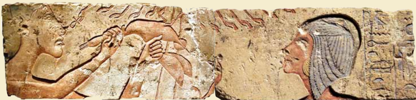
Blok i Metropolitan Museum of Art, New York 1985.328.2.