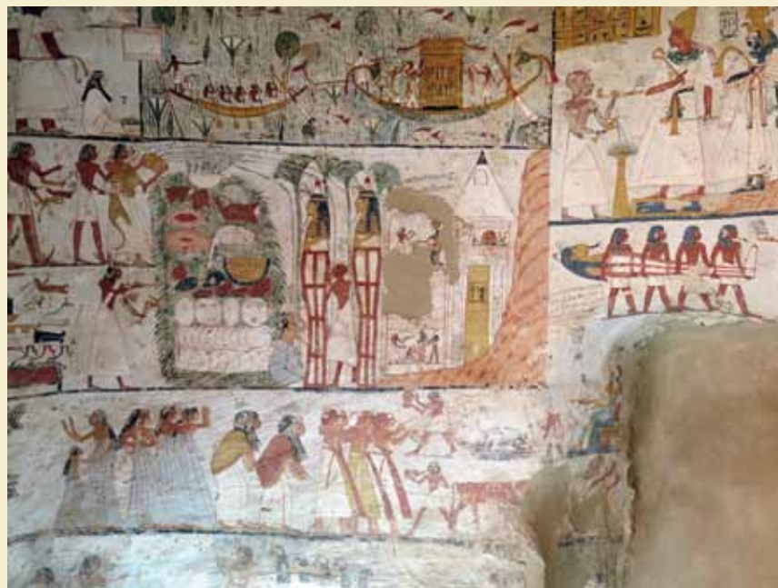
TT 227.