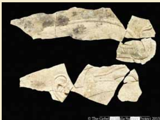
Kalkstensfragmenter af kongehoved.