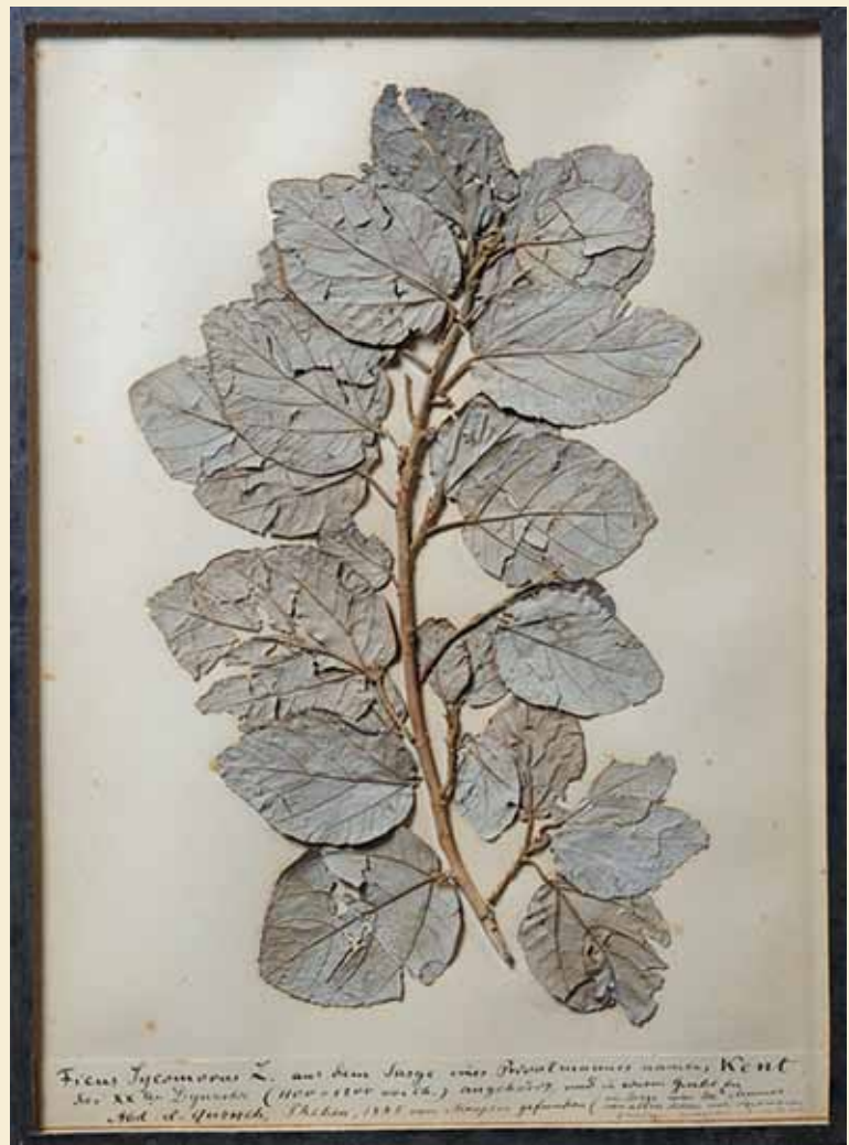
Sykomorekvist ( www.damals.de )

Vol. 2: Die hieratischen Texte . €139 http://www.presse.uni-wuerzburg.de/einblick/single_special/artikel/der-krokod/