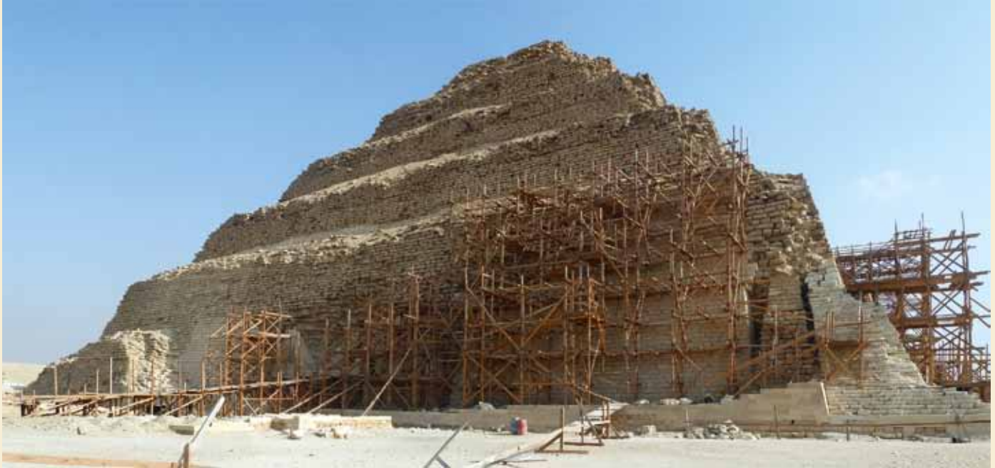
sept. 2011