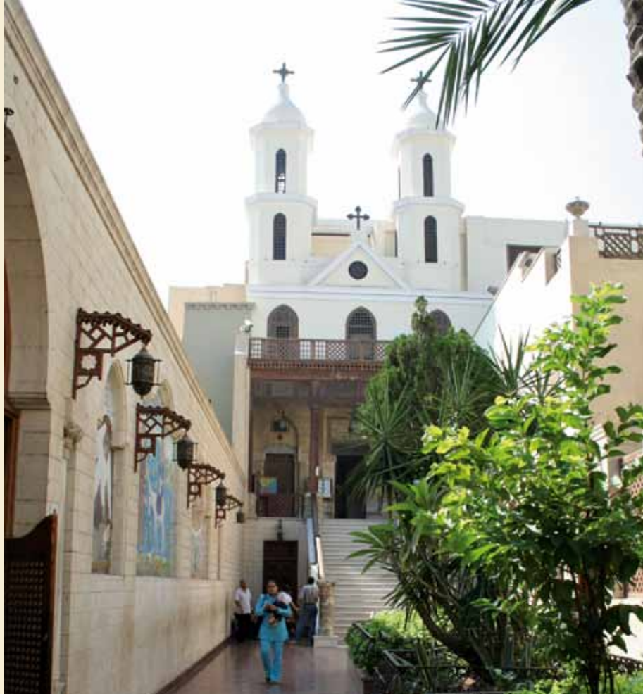
Den hængende kirke.