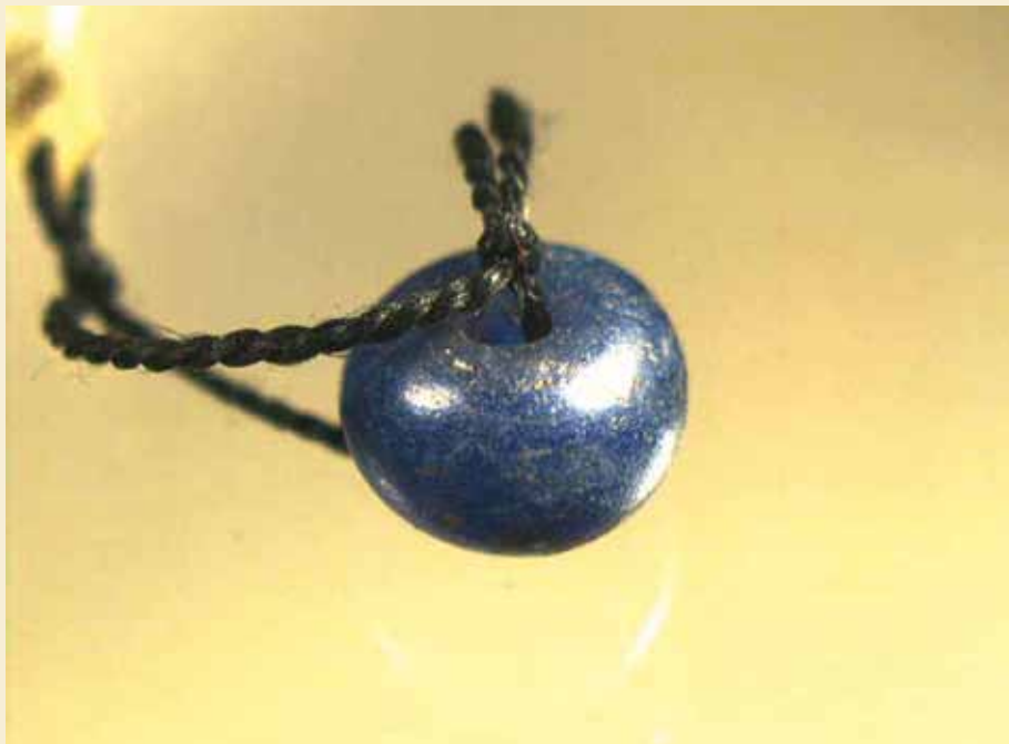
Perlen fra Ølby, Nationalmuseet B2209.