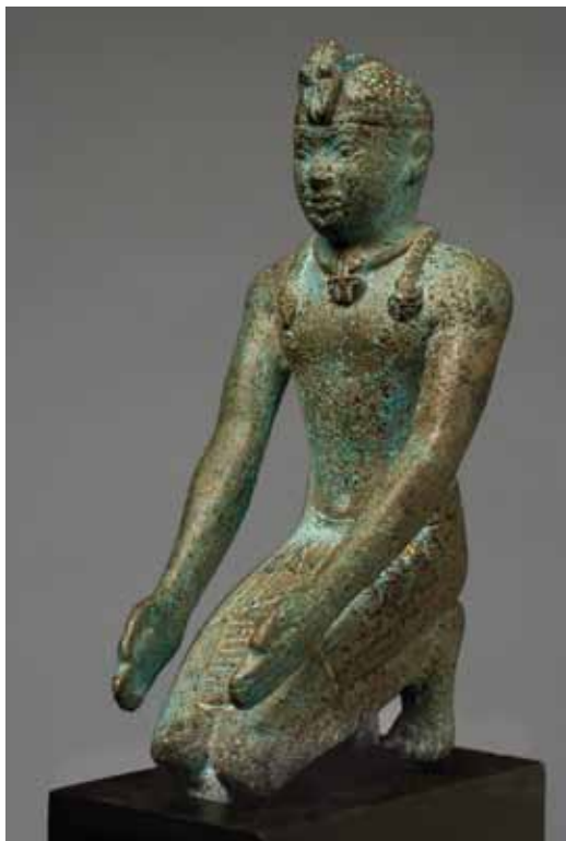
Bronzestatuetten fra Kawa ÆIN 1695.